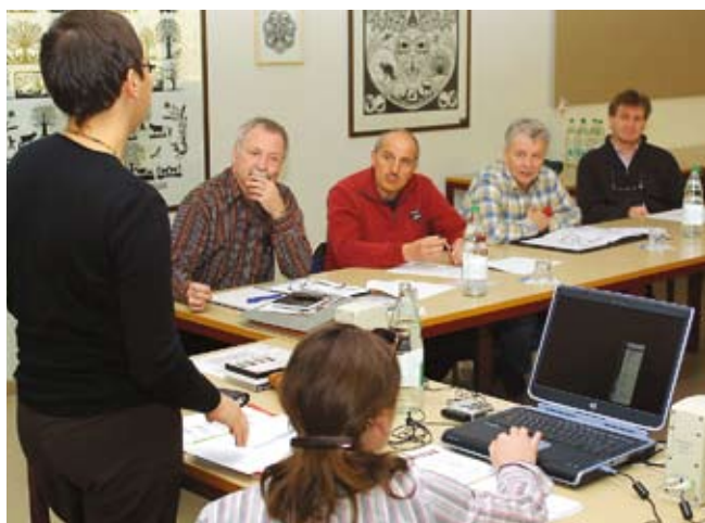
Des spécialistes de l'agriculture, de l'environnement et de l'enseignement accompagnent le projet en devenant «Von Bauern für Bauern».